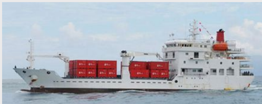
Tuha'A Pae IV

Am Vormittag Ankunft in Papeete und Ausschiffung.