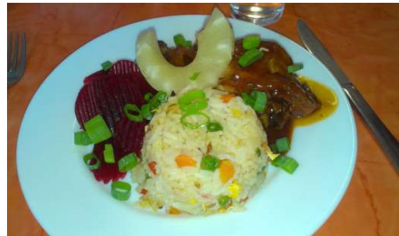
Gutes und reichhaltiges Essen