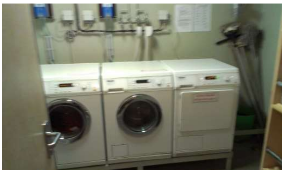
Waschmaschinen, die auch von den Passagieren benützt werden dürfen bei Bedarf.