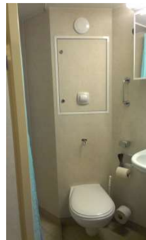
Nasszelle der Einzelkabine