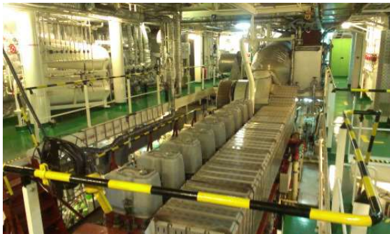
Besuch im Maschinenraum