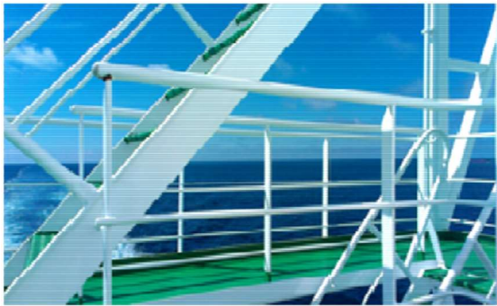
Wunderschöner Tag auf See