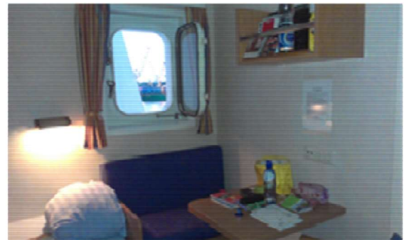
Blick in eine Einzelkabine