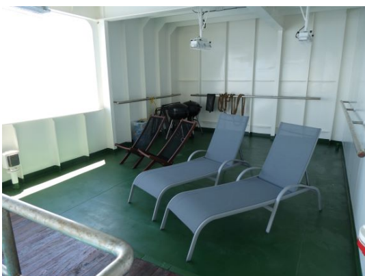
Windgeschützter Aussenbereich für die Passagier