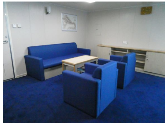
Wohnbereich einer Doppelkabine