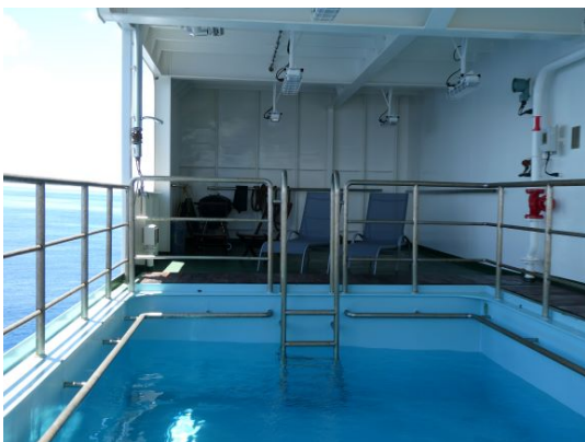
Der kleine Aussenpool