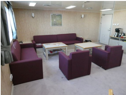
Aufenthaltsraum der Passagiere