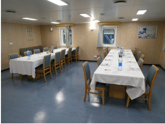
Offiziersmesse, der linke Tisch ist für die Passagiere