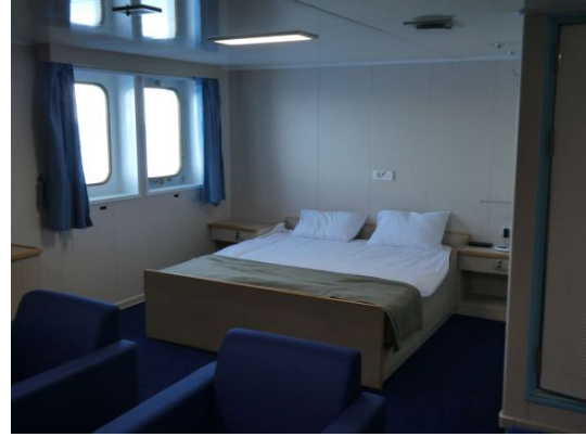
Schlafbereich einer Doppelkabine