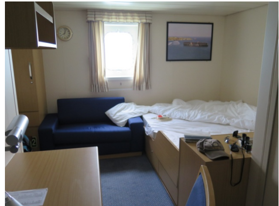
Blick in eine der Doppelkabine