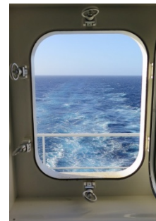
Blick aus der Kabine nach achtern