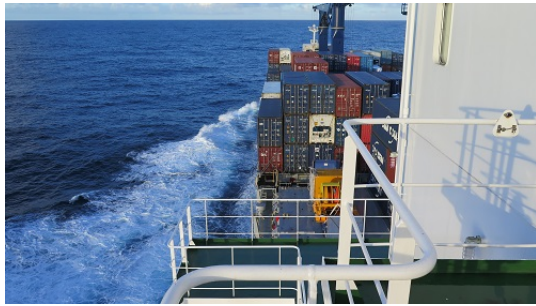
Blick nach vorne vom Deck