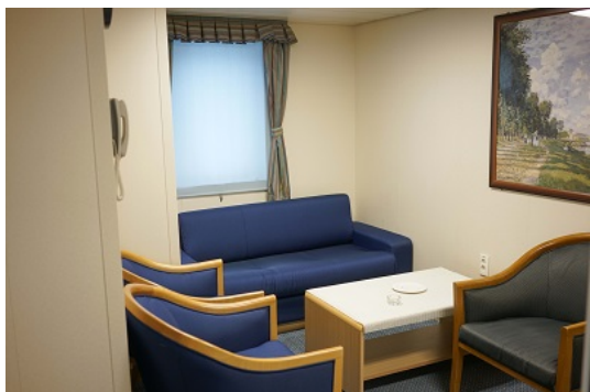
Die kleine Passagierlounge vom Eingang her...