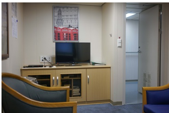
...und von der anderen Richtung